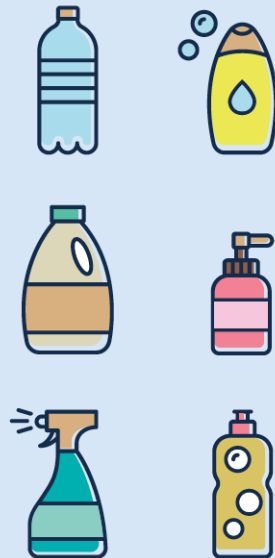
Bouteilles et flacons en plastique Plastikflaschen und -flakons Plastic bottles and containers